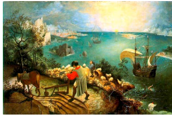
2. Paisaje con la caída de Ícaro . Pieter Bruegel, c. 1558. Óleo sobre tela, 73,5 x 112 cm. Musees Royaux des Beaux-Arts de Belgique, Bruselas.