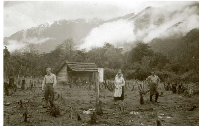
4. Colonizadores de Aysén , c. 1934.

calendarios agrícolas medievales que especifican las labores a realizar en cada estación llevan en honor de las diosas el nombre de “Libro de Horas”: son las precauciones que deben guardarse para que la agricultura pueda sobrevivir a la incertidumbre del tiempo, sabiendo leer la regularidad de su transcurso. La precisa unidad cronométrica que hoy damos por inefable, toma su nombre de las labores o trabajos que inicialmente en cada estación y después en cada momento del día, fueron ordenando una existencia productiva (y luego ritual). El conocimiento de la sucesión regular del clima –a diferencia de lo voluble e impreciso del tiempo– permite sobrellevar la praxis agrícola en medio de la naturaleza.