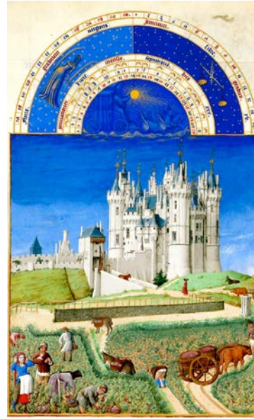
3. Septembre. Les Très Riches Heures du Duc de Berry . Paul Hermann y Jean Limbourg, 1412 – 1416. Museo Condé, Chantilly.