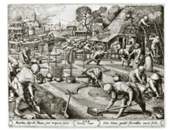
6. Primavera. Pieter van der Heyden sobre Pieter Bruegel el Viejo, 1570. Grabado. National Gallery of Art, Washington.

de es fácil reconocer la matriz del parterre, que una vez despojado de coles y calabazas se contoneará en libertad en el jardín francés del barroco.