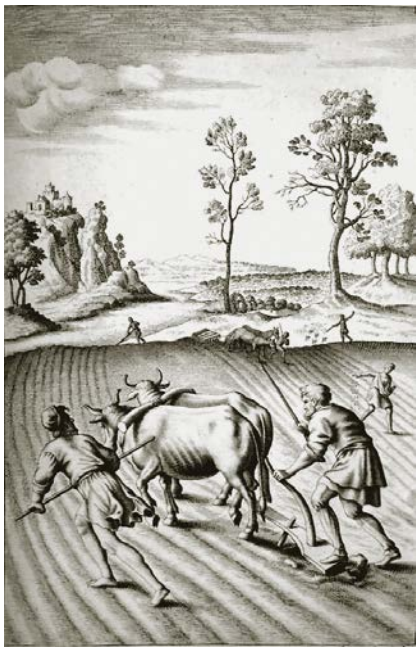
1. Ilustración para Las Geórgicas de Virgilio. Michael Van Der Gucht, c. 1702. Pergamino, 29,5 x 20 cm.